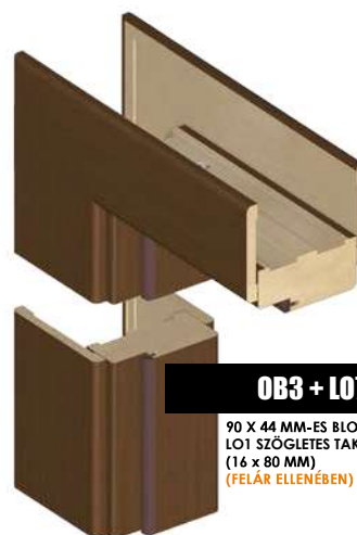
OB3 + LO7 90 X 44 MM-ES BLOKKTOK LO1 SZÖGLETES TAKARÓVAL (16 X 80 MM) (FELÁR ELLENÉBEN)