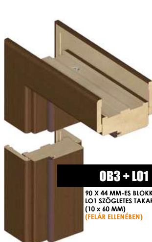
OB3 + LO1 90 X 44 MM-ES BLOKKTOK LO1 SZÖGLETES TAKARÓVAL (10 X 60 MM) (FELÁR ELLENÉBEN)