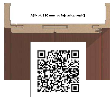
AJTÓTOK SZÉLESSÉGÉNEK ÁLLÍTÁSA